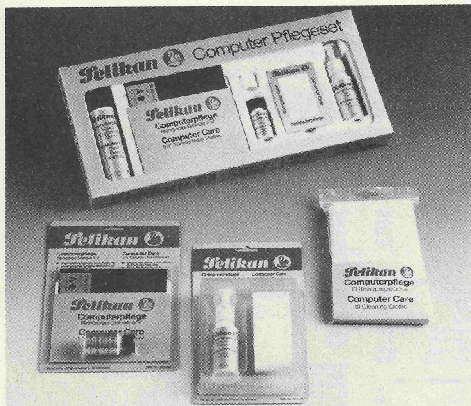
Computer-Pflegesets – erhältlich in verschiedenen Varianten

Pelikan AG Postfach 103 3000 Hannover 1 ☎ 05 11/69 69 8 22